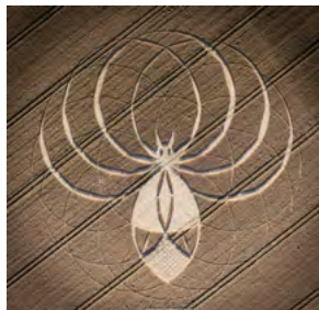
Cerne Abbas Giant