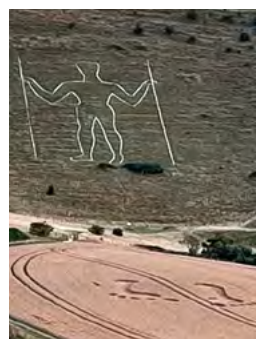
Long Man of Wilmington