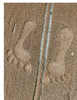
Long Man of Wilmington