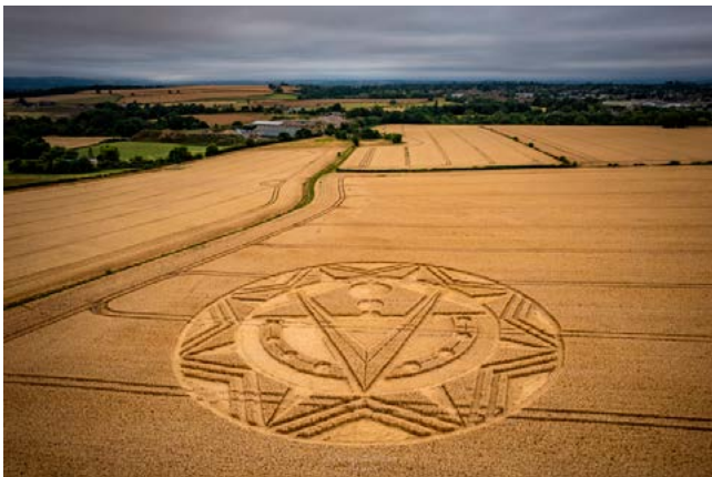
De eerste Etchilhampton formatie