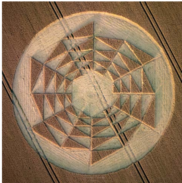
Barbury Castle fase 2