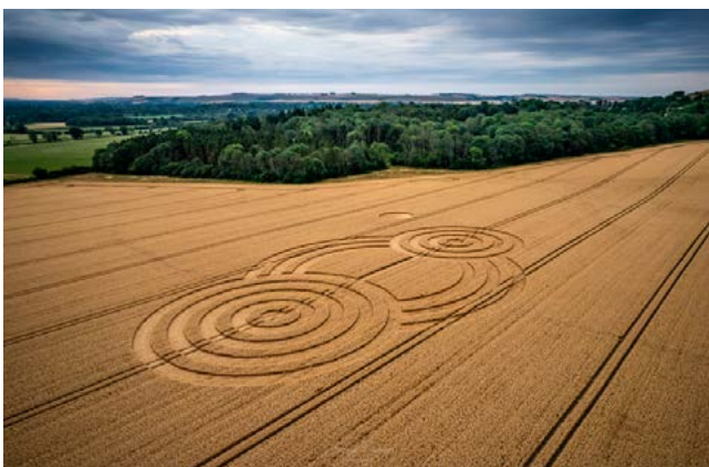
De Tawsemead Copse formatie