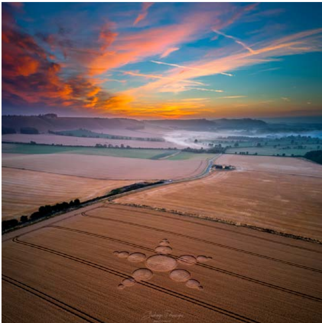
De Southfield formatie

Dit jaar viel Nancy Polet en mij de eer te beurt om de 'Glastonbury Symposium Crop Circle Coach Tour' te leiden. Zeldzaam, want die tour vond al jaren niet meer plaats. Maar om hun dertigjarig jubileum te vieren, wilde ze nog één keer terug naar de basis. Lang verhaal kort, volgend jaar mogen we het weer doen! Slechts één graancirkel konden we bezoeken. De boeren in Wiltshire laten nauwelijks nog mensen toe op hun land, maar deze lag direct naast een zogenaamde public bridleway , ofwel een openbaar voetpad dwars door het graan. De boer kon ons dus niet uit het veld sturen. Dit bleek achteraf gezien het eerste voorval van manifestatie... Graancirkels zijn immers zelfs in Wiltshire geen vanzelfsprekendheid meer. Zeker niet publiek toegankelijk en al helemaal niet voor een bus met vijftig leergierige nieuwe graancirkelaars. Het was voor Nancy en mij, maar ook voor Monique Klinkenbergh