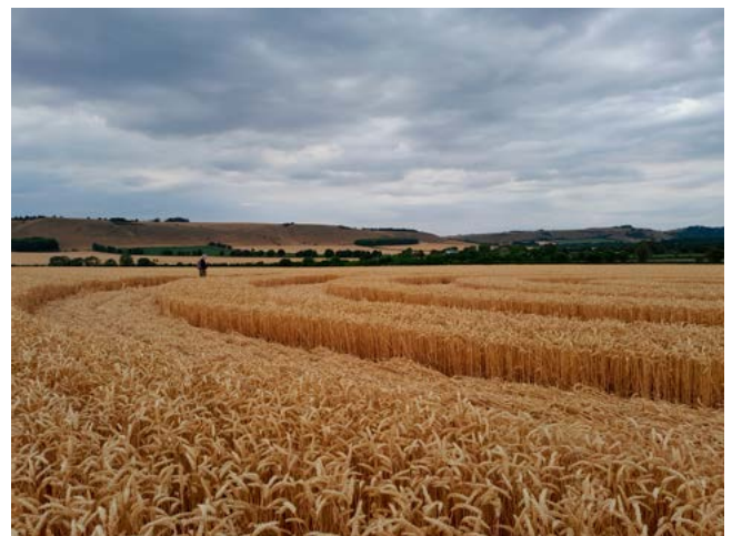
Groundshot van de Tawsemead Copse formatie

volgende ochtend een graancirkel zou moeten ontstaan, niet ver bij ons vandaan. We bespraken het, richtten onze aandacht erop en lieten het vervolgens los. De melding kwam de volgende dag (3 augustus) pas tegen 18.00 uur. Er lag ineens een graancirkel in het veld naast de graancirkel van enkele dagen daarvoor. Saillant detail, de formatie was niet opgemerkt door de werklieden die al de hele dag in de aangrenzende velden aan het werk waren geweest. Hadden we hier te maken met een daytime event ? Dat is heel bijzonder. De formatie bestond uit vijf armen, elk opgebouwd uit drie cirkels rondom één centrale cirkel. Eén arm voor elk van ons? Twee dagen later werd het graancirkelcentrum overspoeld door driehonderd Duitse